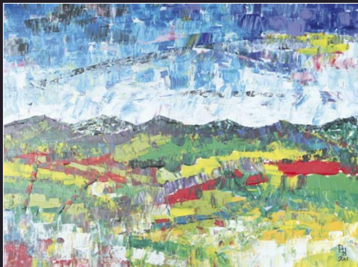
5e prijs: P.J. den Hollander, titel Het paletmes is een span- nend stuk gereedschap. Het gebruikt veel verf en geeft ook veel structuur en vermenging van kleur. Door de vormen in het land- schap eenvoudig te houden is het nog net niet té veel ge- worden in het landschap van P.J. den Hollander.