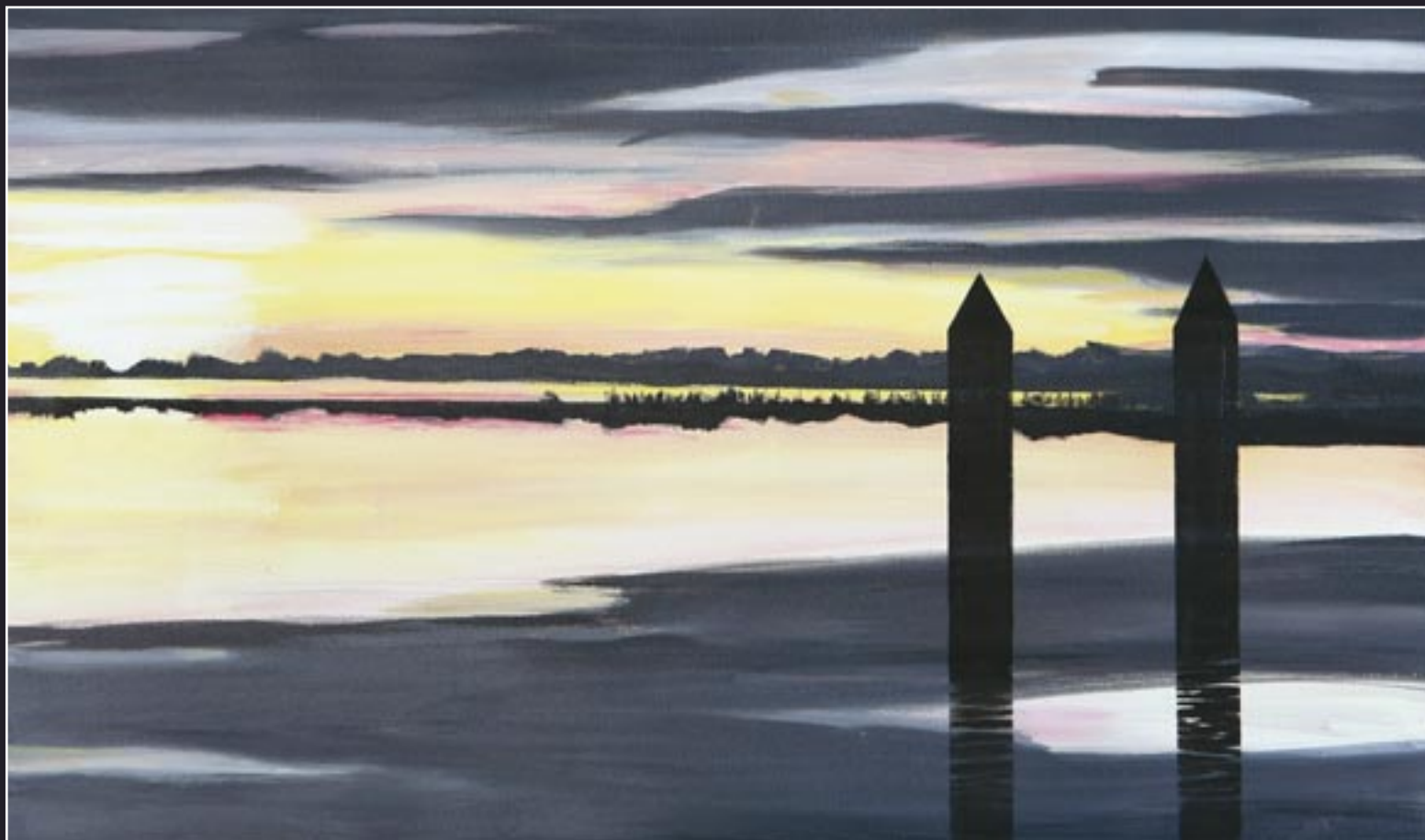
4e prijs: Anne van Delden, titel "Landschap" olieverf op doek afm. 40 x 70 cm. De avond valt en dat is een bijzonder moment om te schilderen. Het laatste felle wit is nog te zien links op het doek. De eenvoud maakt het landschap zo aantrekkelijk. Een verdiende prijs.