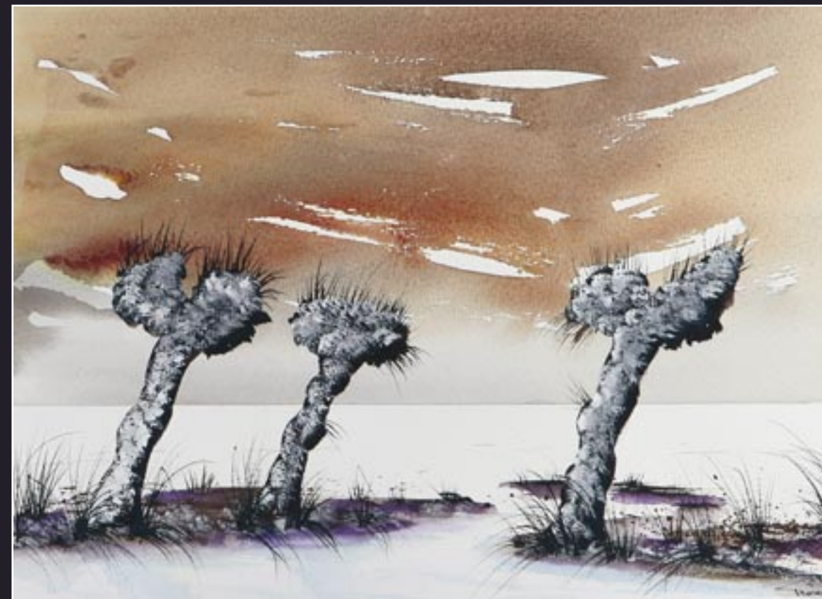
6e prijs: Germaine Prosec, titel "Sneeuwlandschap" gewassen inkttekening afm. 28 x 36 cm. Er zijn verschillende dingen bedacht om dit landschap te maken. Dat maakt het ook zo leuk. Met goed kijken is te zien hoe het is opgebouwd. Dan wordt het steeds mooier. Een verdiende prijs. Proficiat.