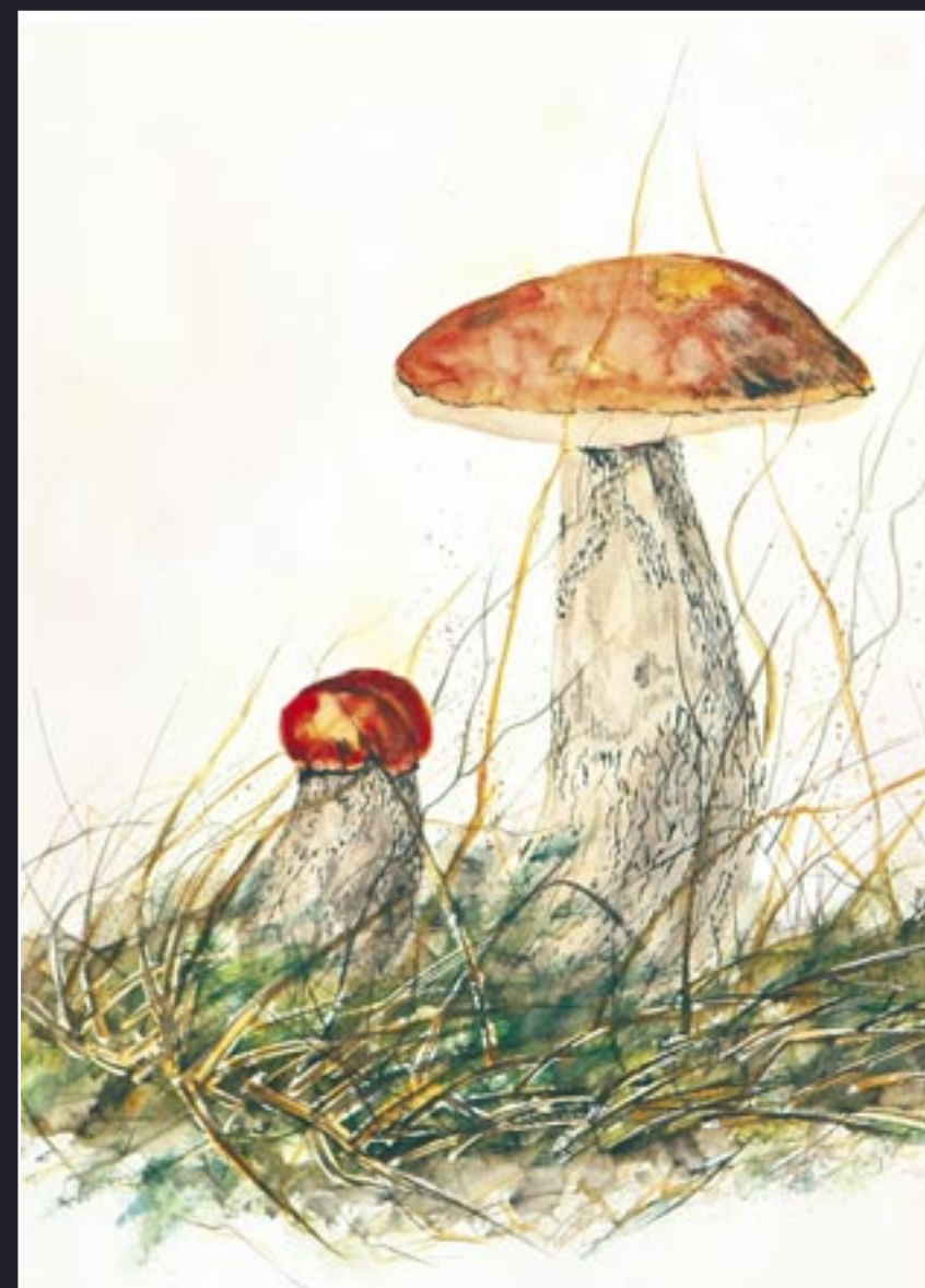
7e prijs: Rosa Cool, titel "Kabouterlandschap" ge- mengde techniek met aquarel afm. 32 x 23 cm. Terwijl de jury met een ventilator ter verkoeling in de warmte zit, zal PALET inderdaad wel in het vroege najaar verschenen zijn. Als sfeermaker alvast dit uitstekende aquarelletje van Rosa, die ons met een verfijnde techniek - met spatjes - zeer eetbare Eekhoornbrood voorschot- telt. Maar Rosa maakt een aquarel, het is schilder- kunst, dus illusie!